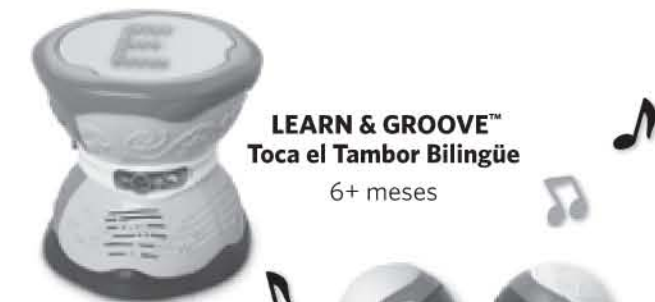
LEARN & GROOVE™ Toca el Tambor Bilingüe 6+ meses

Los premiados productos Learn & Groove de LeapFrog le brindarán al niño un excelente punto de partida para su desarrollo temprano.