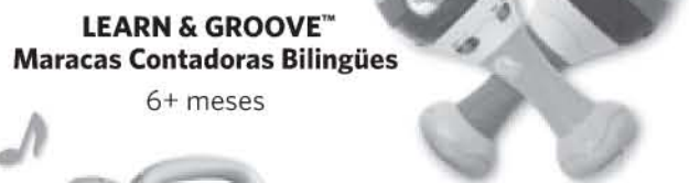
LEARN & GROOVE™ Maracas Contadoras Bilingües 6+ meses