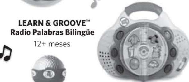
LEARN & GROOVE™ Radio Palabras Bilingüe 12+ meses