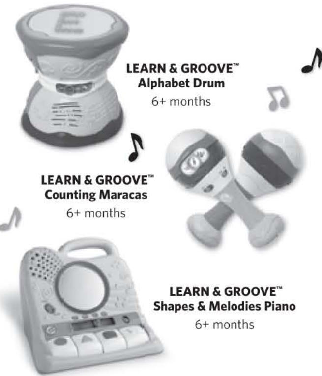
LEARN & GROOVE™ Alphabet Drum 6+ months

Your child is sure to get early development off to a notable start with award-winning products in LeapFrog's Learn & Groove range.