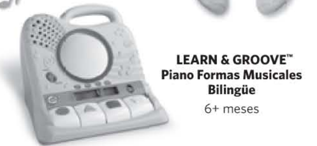
LEARN & GROOVE™ Piano Formas Musicales Bilingüe 6+ meses