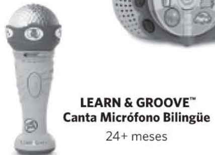
LEARN & GROOVE™ Canta Micrófono Bilingüe 24+ meses