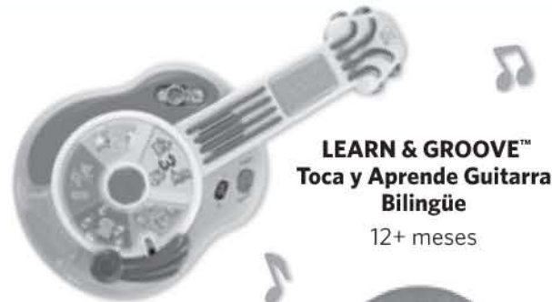
LEARN & GROOVE™ Toca y Aprende Guitara Bilingüe 12+ meses