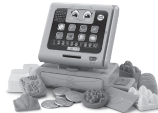
Count Along Register/Count Along Till 2+ years