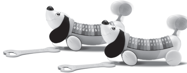
AlphaPup™ 12+ months

Impact de l'environnement. Une défaillance de fonctionnement de l'appareil peut survenir s'il est sujet à des interférences avec les fréquences radioélectriques. Le fonctionnement normal de l'appareil devrait reprendre avec l'arrêt des interférences. Si ce n'est pas le cas, il peut s'avérer nécessaire d'éteindre et rallumer l'appareil ou de retirer et réinstaller les piles. Dans l'éventualité peu probable d'une décharge électrostatique, un mauvais fonctionnement et une perte de mémoire de l'appareil peuvent se produire. L'utilisateur doit alors retirer et réinstaller les piles pour réinitialiser l'appareil.