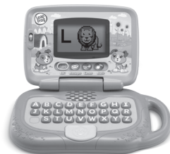
My Own Leaptop™ 2+ years