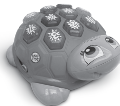
Melody the Musical Turtle™ 2+ years