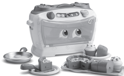
Number Lovin' Oven 2+ years

Recycle. Find out how to recycle this product at leapfrog.com/recycle or call (800) 701-5327. For UK consumers, visit www.leapfrog.co.uk/recycle and /support .