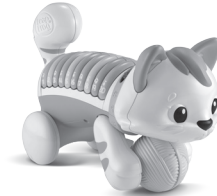
Count & Crawl Kitty 9+ months

Recycle. Find out how to recycle this product at leapfrog.com/recycle or call (800) 701-5327. For UK consumers, visit leapfrog.co.uk/recycle .