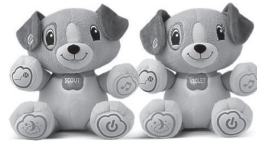
My Pal Scout/Violet™ 6+ months