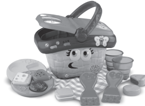
Shapes & Sharing Picnic Basket 6+ months